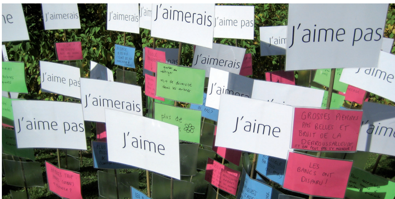
Résultats d'un processus participatif avec marche commentée, Villars-sur-Glâne

Avec ses activités, l'association Lares s'engage en faveur d'un changement culturel dans la planification et la construction. www.lares.ch