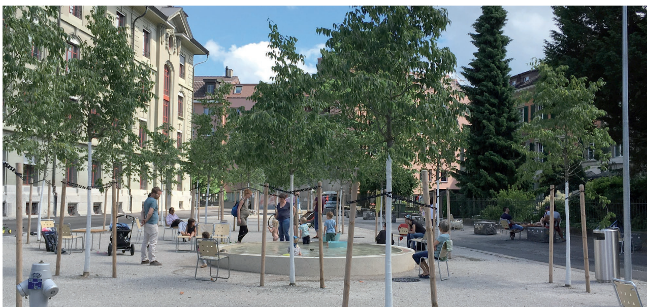
La nouvelle place de quartier offre un espace pour les rencontres, avec des arbres, de l'ombre, une fontaine et des sièges pour petit*es et grand*es ; Mittelstrasse, Berne.

Ce guide utilise le langage inclusif avec des astérisques, par exemple utilisateur*trices, femmes*, hommes* : ainsi, il considère tout le spectre des genres et identités sexuelles, en dépassant la binarité féminin-masculin.