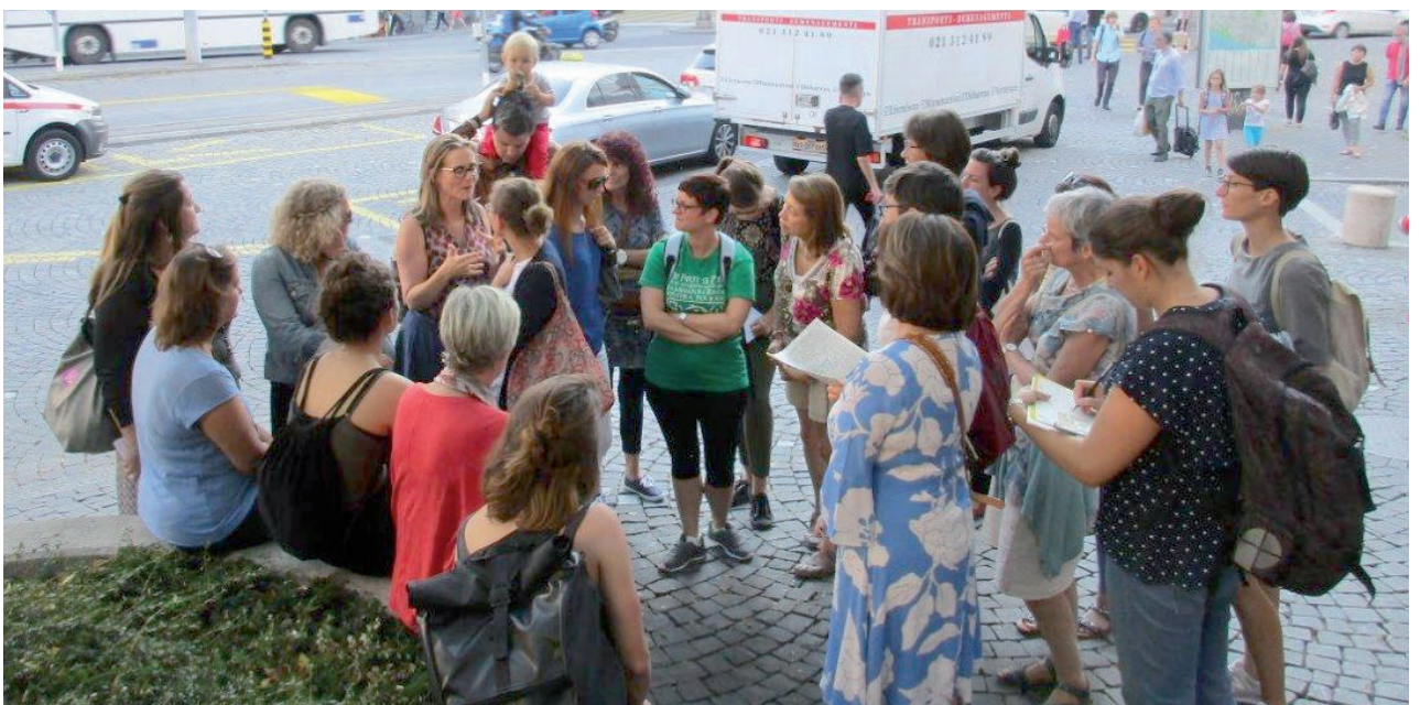
Marche participative avec des femmes à Lausanne

La participation et l'implication active peuvent également être explicitement revendiquées, notamment par les électeur*trices.